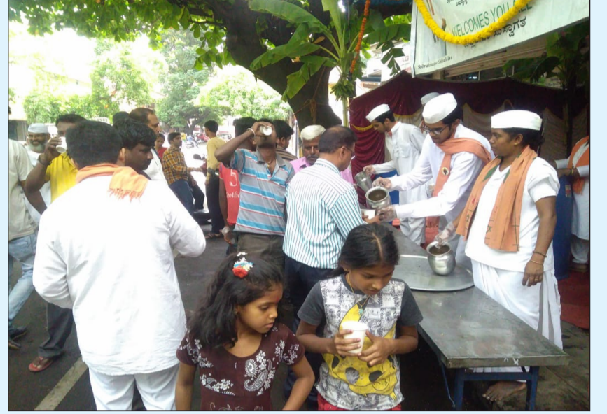
Distribution of Butter Milk at Kathriguppe

SSBSSF is celebrating 1 st May of every year by distributing Butter milk and Paanaka to the public since 2012 at various locations in Bengaluru.